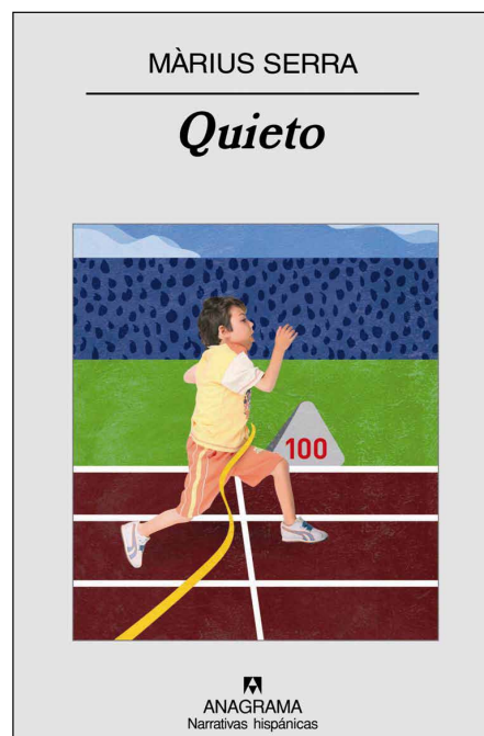
Màrius Serra: Quieto Barcelona: Anagrama, 2008

Éste es un artículo escrito desde la parcialidad más objetiva. Empezaré, pues, poniendo algunas cartas encima de la mesa.