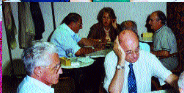
Los médicos disponen de un espacio propio para sus actividades en el Casal Dr. Josep Espriu Castelló.

mas, dedicado a lo que se llama prestación complementaria a la dedicación profesional .