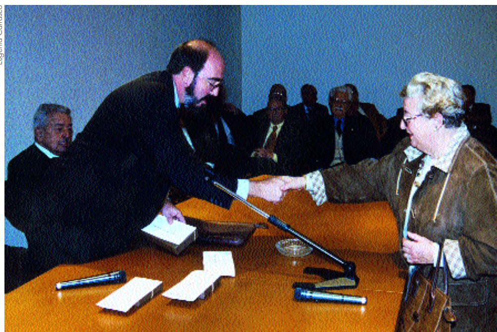
El Montepío celebra mensualmente una reunión de acogida a los médicos que han cumplido su 70 aniversario.

Establecida en 1973, la cuantía de la prestación se fija en función de la edad del socio en el momento de su muerte, a partir de una escala que varía de un mínimo de 100.000 pesetas